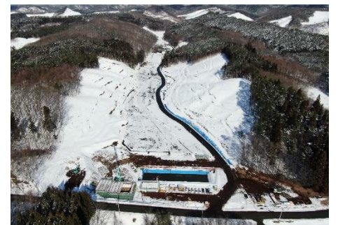
処分場全景（3月上旬）