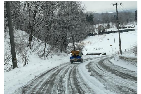
融雪剤散布状況（処分場内及び場外）