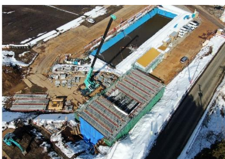
付替河川（水路流末部）の全景