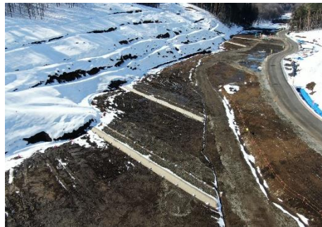
土砂流出防止対策